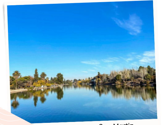
Parque San Martin