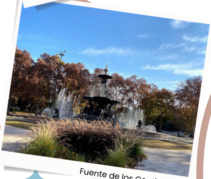
Fuente de los Continentes